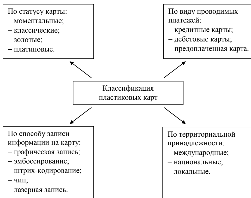
Рисунок 1 – Классификация пластиковых карт

Название рисунка пишется под рисунком по центру, начиная со слова Рисунок 1. После номера точка не ставится , ставится тире и с большой буквы пишется название. После названия точка не ставится.